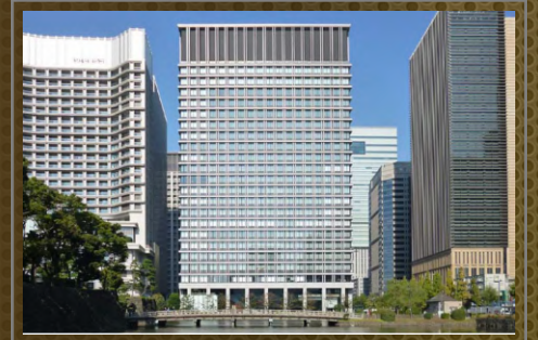
Salesforce Tower Tokyo