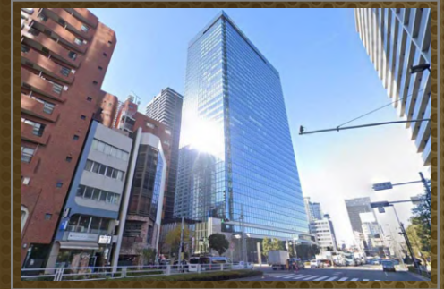
新宿ファーストタワー