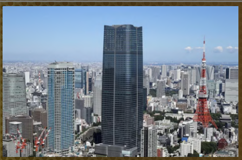
麻布台ヒルズ森JPタワー