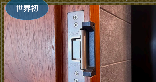
世界初 停電時に「解錠」「施錠」を選択できる 切替可能の電気ストライク