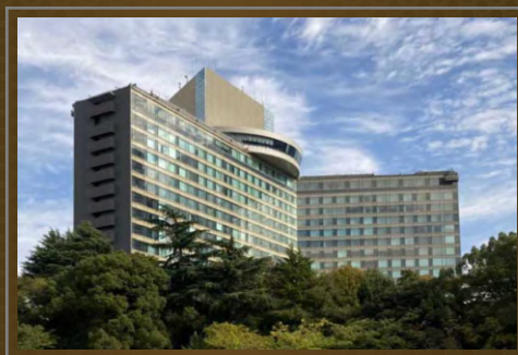
Hotel New Otani