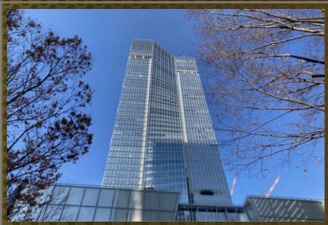
虎ノ門ヒルズステーションタワー

建築本来の美しさを、決して邪魔しない。 装置本体を上枠内に完全に格納することで、 圧倒的にスマートなエントランスを実現する革新的なオートドアシステムです。 視界を遮る後付け感や機械的な露出が一切ないため、 洗練されたデザインの価値を最大限に引き出し、施設の品格を一段と高めます。 また、外部に装置が露出しないことは、 いたずらや不測の破損リスクを根本から排除することに繋がります。 高い防犯性とメンテナンス性を兼ね備えた、 現代の建築美にふさわしい理想のドアソリューションです。