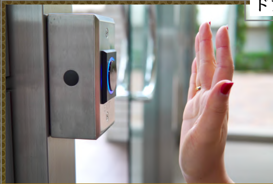
ドアを開けるための非接触センサースイッチ