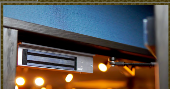
世界基準「停電時解錠」式の マグネット電気錠