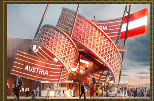
大阪万博：オーストリアパビリオン