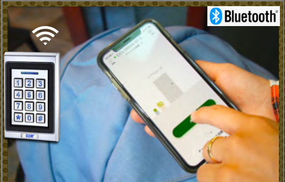
スマホアプリで簡単にオープン (Bluetoothカードリーダー)