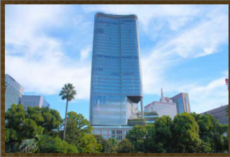
東京ミッドタウン日比谷